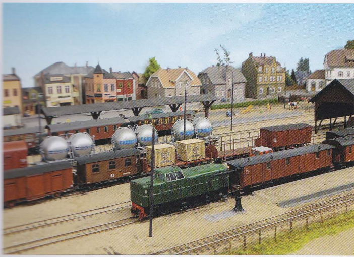
Trafiken på Wilsaleda är livlig. Här möts normalspår och smalspår.