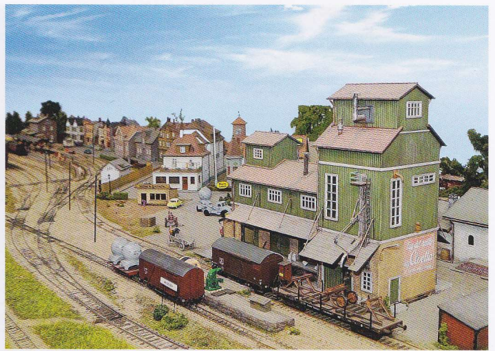
Vid Lantmännens magasin i Wilsaleda sker ett ständigt utbyte av förnödenheter och spannmål.